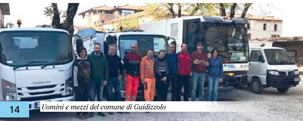
Uomini e mezzi del comune di Guidizzolo

Ci siamo concentrati sui cittadini che vivono soli, la cui quota si è abbassata del 18%, passando da 107 a 88 euro. Parte dei servizi è migliorata, la spazzatrice è operativa quattro volte la settimana anziché due al mese, come accadeva durante la gestione di Mantova Ambiente».