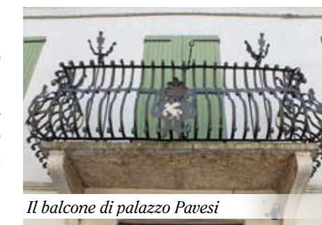
Il balcone di palazzo Pavesi

casa potesse divenire la sede del museo archeologico della Postumia, essendo socio e grande sostenitore dell'associazione omonima. In occasione dello scorso consiglio comunale, ci ha fatto visita l'assessore regionale alla cultura, con il quale abbiamo discusso della possibilità di ottenere fondi da utilizzare per la valorizzazione del palazzo e il compimento del progetto museale, al fine di farlo diventare il centro culturale del nostro comune e, più in generale, di un territorio vasto ma omogeneo.