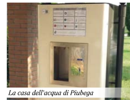
La casa dell'acqua di Piubega

Una delle cose di cui vado più fiero è la riduzione del debito che, nel corso di questi quattro anni di amministrazione, è passato da circa due milioni, a un milione seicentomila euro, il tutto senza accedere a nuovi mutui e senza abbassare il livello dei servizi. Quest'anno, inoltre, avremo a disposizione un avanzo di bilancio di circa 800 mila euro, una cifra importante, ottenuta anche grazie alla vendita di un'area artigianale. Stiamo, inoltre, per portare a termine la nuova illuminazione pubblica e finanzieremo la manutenzione della torre. Tra i nostri progetti c'è, inoltre, la riqualificazione dei giardini e stamo e dell'intera via Roma, attraverso marciapiedi, aiuole e ciclabili.